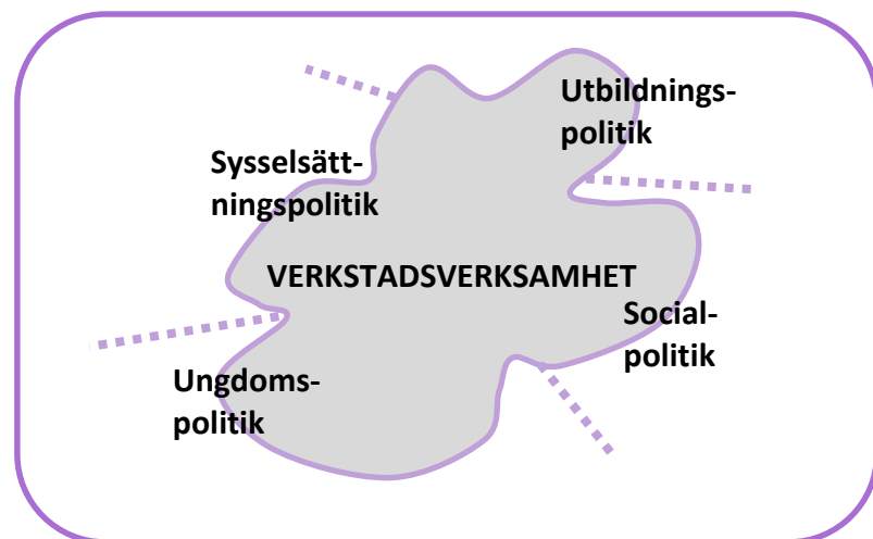
FIGUR 5. Verkstadsverksamhetens placering. Ungdoms-, social- och utbildningsväsendet samt TE-tjänsterna granskar verkstadsverksamheten och dess resultat ur olika synvinklar.

Verkstadsverksamheten placerar sig i servicesystemets mellanrum, i gränzonerna för och mellan de olika sektorerna. Verkstadsverksamheten hör förutom till sysselsättnings- och ungdomspolitiken även starkt till utbildnings- och socialpolitiken. Verkstadsverksamheten eller dess innehåll är inte bestämd i vår lagstiftning, men de träningstjänster som verkstaden genomför styrs av lagstiftningen.