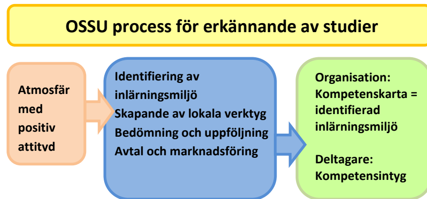
FIGUR 2. OSSU process för erkännande av studier. Det kunnande som har tillägnats på verkstaden beskrivs med läroplanens termer.

Erkännande av studier på verkstaden grundar sig på tanken om livslångt lärande. Erkännandet av studier innebär att man tar reda på deltagarens tidigare kunnande och identifierar det yrkeskunnande som deltagaren har tillägnat sig under träningen. Det identifierade kunnandet dokumenteras i kompetensintyget. Deltagarens förvärvade kunnande synliggörs och kan användas på deltagarens fortsatta väg.