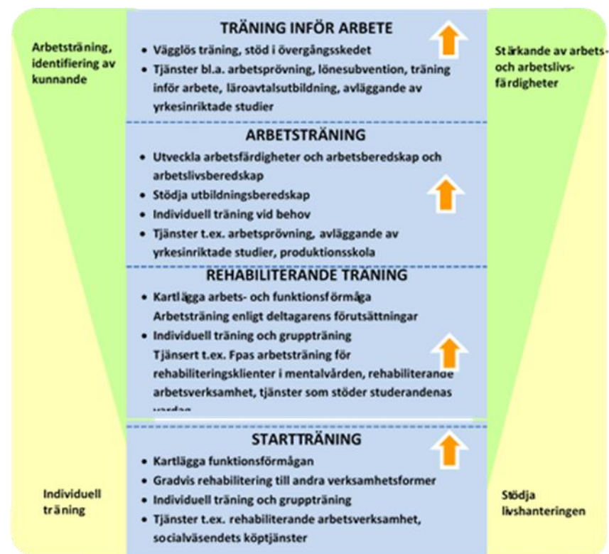
FIGUR 1. Verkstadens träningstjänster. Med träningen svarar man mot deltagarens behov enligt varje individuell situation.

Träningen på verkstaden sker enligt principerna för fostran och pedagogik . Den karaktäriseras förutom av deltagarorientering och skräddarsydd planering bland annat av uppbyggande av gemenskap, flexibilitet och reaktionsförmåga. För träningsprocessen behövs förutom metodisk kunskande även tillräckligt med tid.